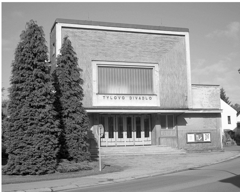
Budova Tylova divadla v Lomnici nad Popelkou (říjen 2004)