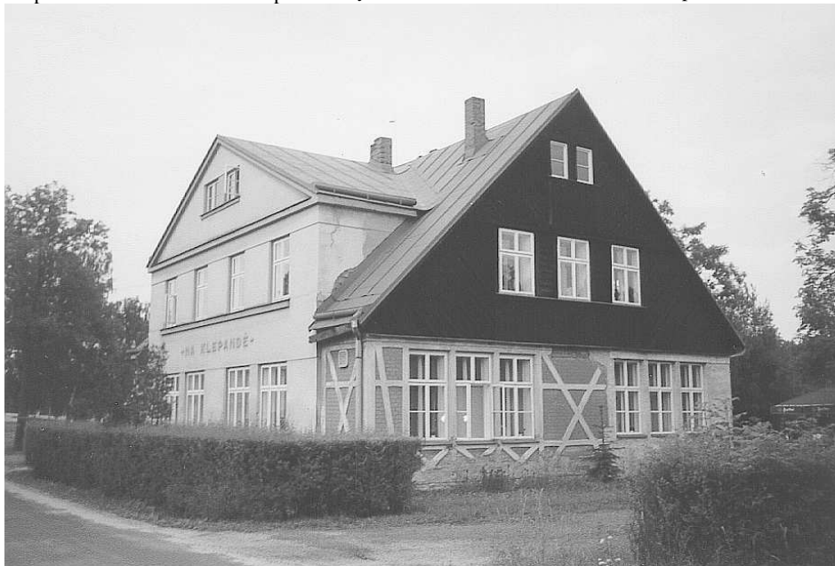
A takto vypadá hospoda dnes (foto léto 2000)

Do pomyslné kroniky hospody "Na Klepandě" zapisují hostinští i návštěvníci další a další stránky. Věřme, že jich popíše ještě mnoho.