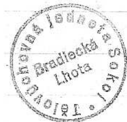
Razítka lhoteckého Sokola. (První se používalo v letech 1920-1952, druhé od r.1952 a poslední od r.1957)

4 ženy. Pokračovalo se i v pravidelných výletech. Počet členů Sokola začal opět stoupat a r. 1967 jich bylo 42. V této době byla nedílnou součástí činnosti Sokola i pomoc při práci v zemědělství a na obecních stavbách. Po kulturním domě se začalo budovat koupaliště a hřiště u KD. Do KD daroval OV ČSTV naší jednotě kruhy, střední bradla, kozu, pružný můstek a dva ribstoly. Zakoupena byla lavička. R. 1973 bylo dokončeno hřiště u KD a Sokol měl v té době 39 členů. R. 1975 přišel na hřiště antukový povrch a na spartakiádu nacvičovalo 10 žen, z nichž do Prahy jely 4. R. 1977 se vycházkami po okolí začal plnit odznak 100 jarních kilometrů a v zimě se konaly závody na lyžích. Od r. 1979 navázal Sokol na hraní divadla a děti nacvičily první pohádku. Koncem sedmdesátých let vznikl při Sokole oddíl stolního tenisu a zanedlouho začali muži hrát okresní soutěž. Počátkem osmdesátých let se k nim přidali i žáci a žákyně. Jejich družstva patřila k nejlepším v okrese, a tak na turnaje, které se ve Lhotě začaly pořádat, jezdili mladí hráči a hráčky z širokého okolí (účast bývala kolem 40 stolních tenistů). Začaly se také pořádat vánoční turnaje pro neregistrované hráče. Od r. 1979 pořádal Sokol na hřišti volejbalové turnaje. Na spartakiádu v r. 1980 nacvičovalo mladší žactvo a ženy a na tu v r. 1985 se do Prahy vypravily opět 4 ženy (celkem jich nacvičovalo 9). V roce 1986 se členská