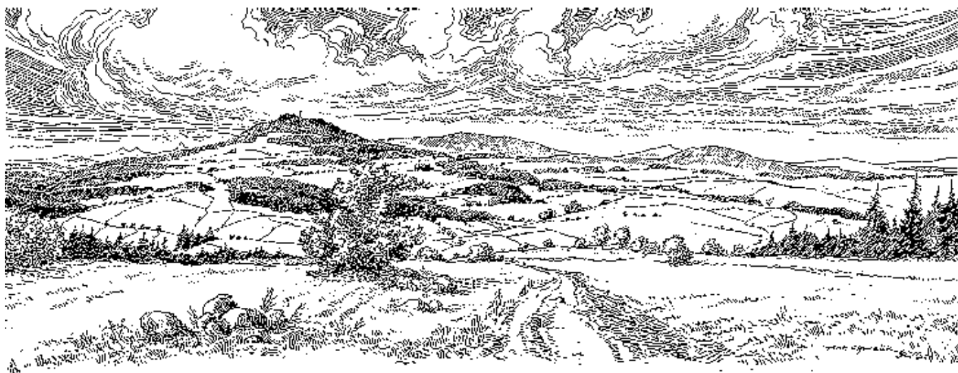
Členitá krajina Lomnicka se svými kopci, údolmi, hlubokými lesy a starými hrady je opředená celou řadou mystérií a pověstí, o kterých si zdejší lidé povídají již mnoho generací. (Antonín Chmelík, Pohled k Táboru)

vždy strhl na chodbách hrozný hluk, jako by někdo sudy válel. Všichni obyvatelé tvrže hlomoz slyšeli, ale nikoho nikdy nespatriili.